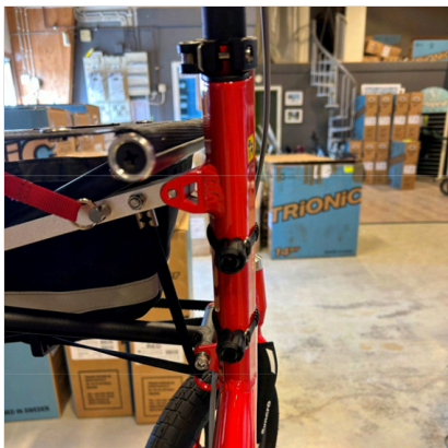
⑥ 此 帶 應 穿 過 此 孔 穿 入 車 架 內。