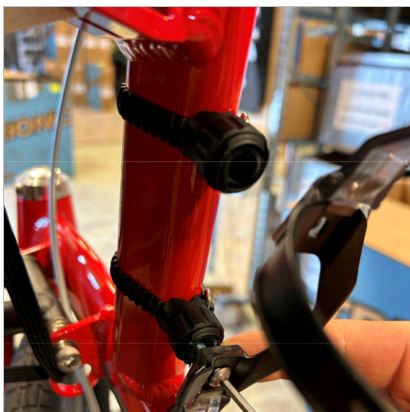
⑦ 此 帶 應 穿 過 此 孔 穿 入 車 架 內。此 帶 應 穿 過 此 孔 穿 入 車 架 內。