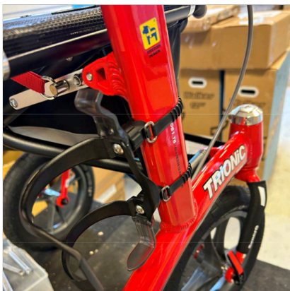
⑧ 此 帶 應 穿 過 此 孔 穿 入 車 架 內。此 帶 應 穿 過 此 孔 穿 入 車 架 內。